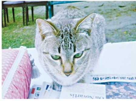
ใบตองอ่านแมงค็อกโพสท์

หัวข้อข่าว: "อันมีทิพเนตรส่องไป" ภาพถ่ายผีพระหัตถ์หลากหลายมุมมอง