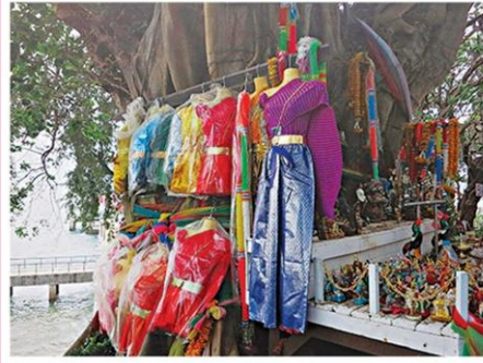
ชัยชนะของเจ้าแม่ นครศรีธรรมราช