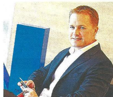
แกรนท์ แมคบีธ

บนระบบปฏิบัติการวินโดวส์8 ด้วยเช่นกัน "วินโดวส์ 8 ของโนเกียมีแอปพลิเคชันเฉพาะของโนเกียเท่านั้น เช่น แอปพลิเคชันข่าวสารเสียงเรียกเข้า โปรแกรมแต่งภาพในรูป